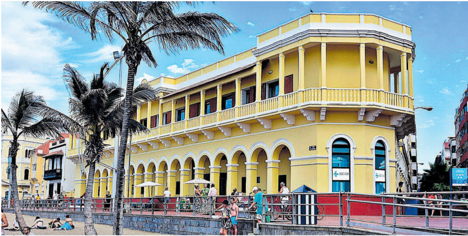
El Hospital San José (1891), amplía sus servicios médicos incorporando la Medicina Ambiental a su avanzada oferta asistencial.